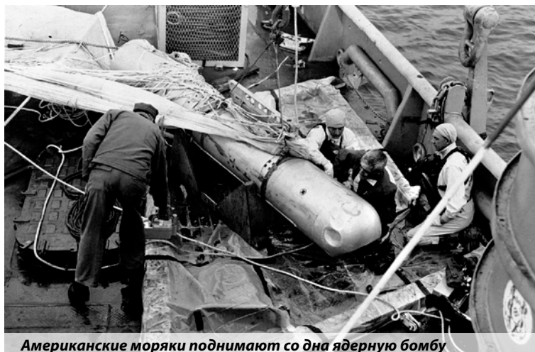
Американские моряки поднимают со дна ядерную бомбу

Хотя благодаря рыбаку, получившему после этого прозвище «Пако эль де ла бомба», район поисков стал более определенным, они по-прежнему оставались чрезвычай-