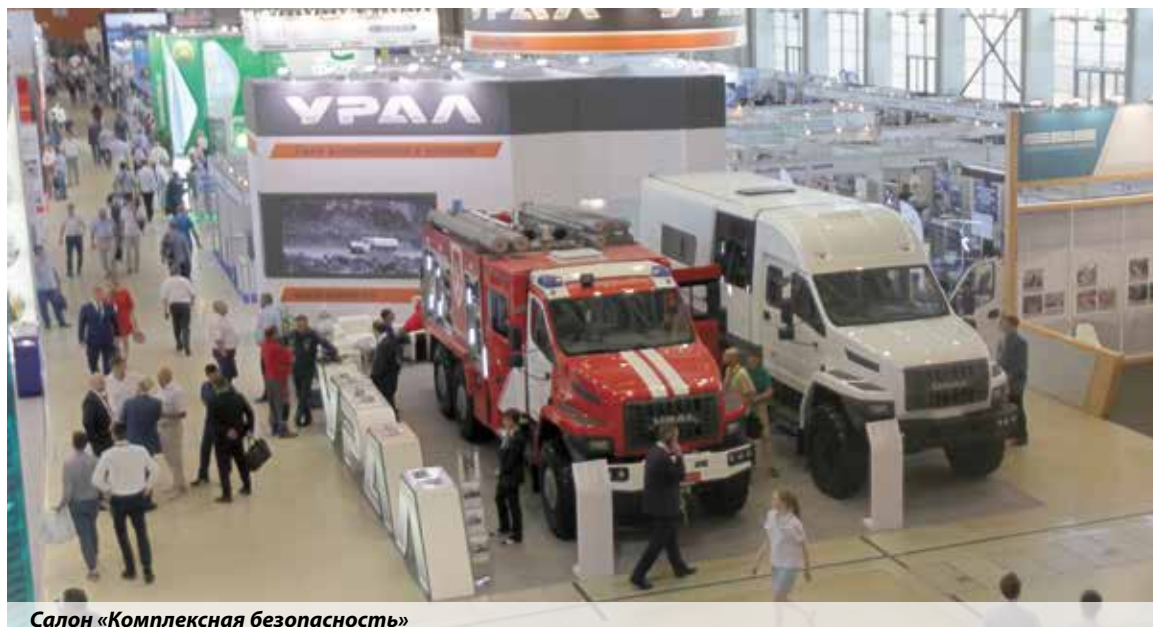
Салон «Комплексная безопасность»

в парке «Патриот» в подмосковной Кубинке и на полигоне Ногинского спасательного центра.