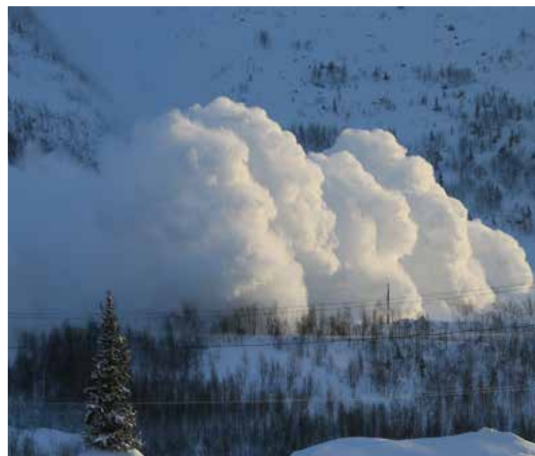
Лавины в Хибинских горах представляют особую опасность