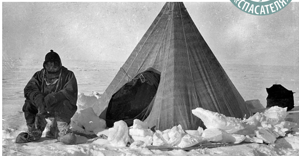
Ночевка на льдине была опаснее, чем плавание рядом с ней

Это решение едва не стало фатальным. Около полуночи льдина раскололась, и один из полярников оказался в воде. Благодаря решительным действиям Шеклтона он был спасен, отделавшись лишь незапланированным купанием. Благо еще оставался запас