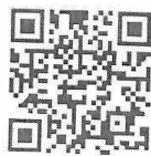
Сервис «Личный кабинет»

Электронный сервис ФНС России «Личный кабинет налогоплательщика для физических лиц» позволяет не выходя из дома: