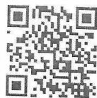
Сервис «Информирования о задолженности»